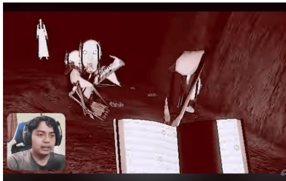
Gambar 4. Seorang Pemain Game dari Game Ghaib

memiliki unsur edukasi yang lebih dominan dibanding hiburannya. Aspek ini dapat dinilai dari berbagai elemen dalam game . Elemen cerita, gameplay , serta target atau goals dari game . Selain itu, elemen ruang dan suasana juga memberikan pengaruh besar.