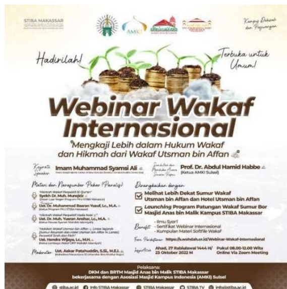
Gambar 5. Webinar Wakaf Internasional