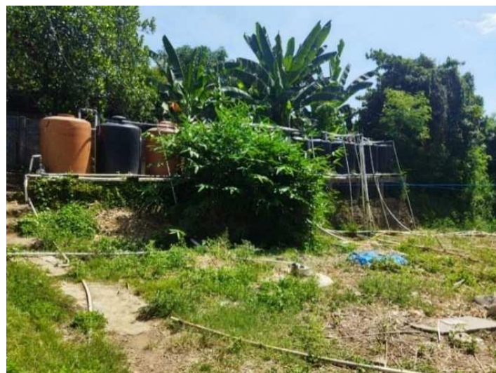
Gambar 3. Lokasi Sumber Mata Air Sumur Bor