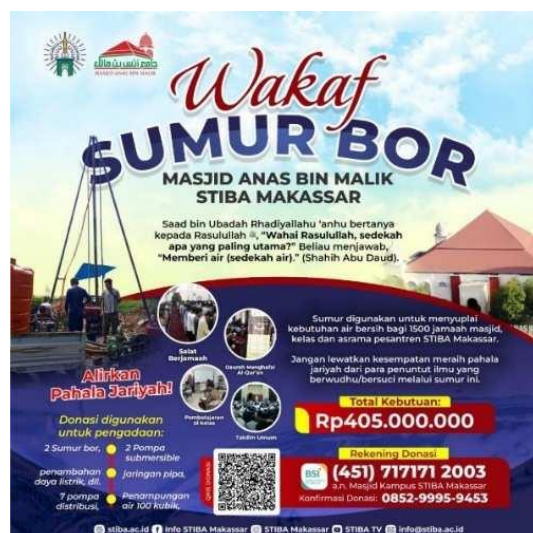
Gambar 6. Contoh Flyer Ajakan