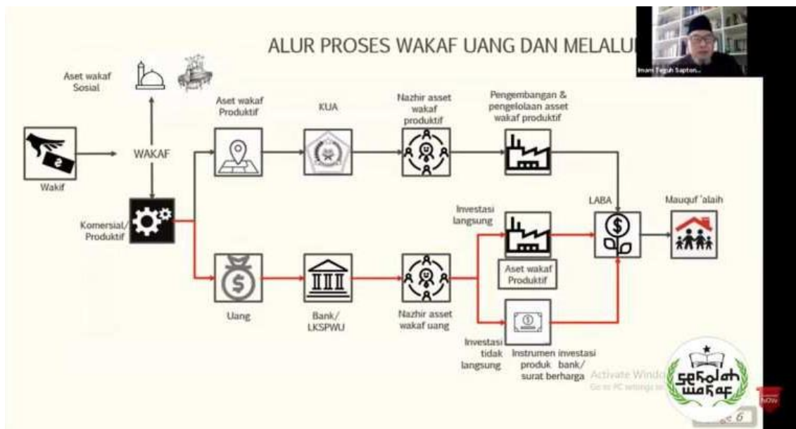
Gambar 1. Skema Pengelolaan wakaf uang dan Melalui Uang

Wakaf adalah salah satu bentuk amal yang melibatkan penyerahan aset oleh seorang wakif untuk dimanfaatkan secara produktif. Aset yang diwakafkan bisa berupa uang atau aset produktif lainnya, yang kemudian disalurkan ke lembaga yang berwenang seperti bank atau Lembaga Keuangan Syariah Penerima Wakaf Uang (LKSPWU) untuk wakaf uang, atau langsung ke Nazir aset wakaf produktif melalui Kantor Urusan Agama (KUA) untuk aset produktif. Nazir, sebagai pengelola aset wakaf, bertanggung jawab untuk mengembangkan dan mengelola aset tersebut agar produktif dan menghasilkan keuntungan yang akan didistribusikan kepada penerima manfaat yang telah ditentukan.