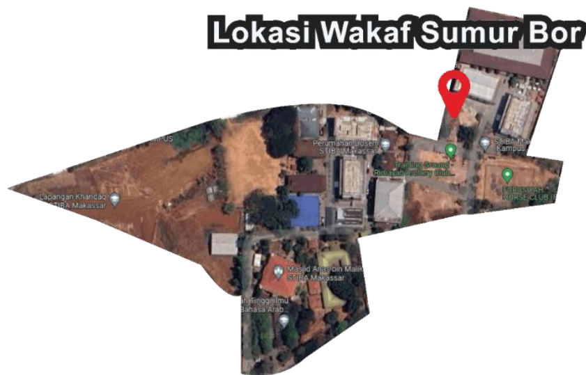
Gambar 2. Denah STIBA Makassar

Lokasi sumber mata air sumur bor terletak di sebelah barat daya Gedung Aisyah, dengan titik koordinat 5^{\circ}09'44.1''S 119^{\circ}30'33.4''E . Di lokasi ini, terdapat 10 tandon (penampungan air) yang masing-masing berkapasitas 2200 liter, serta 3 pompa air bertenaga listrik yang digunakan untuk mengalirkan air dari titik sumber mata air bor.