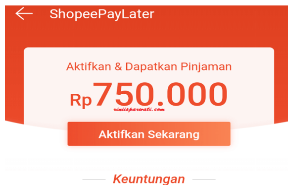
Gambar 1. Screenshot Situs Shopee

Setelah memenuhi persyaratan dan ketentuan, pengguna bisa mencoba melakukan transaksi pembelian dengan batasan limit yang ada dan memilih Shopee PayLater sebagai metode pembayaran.