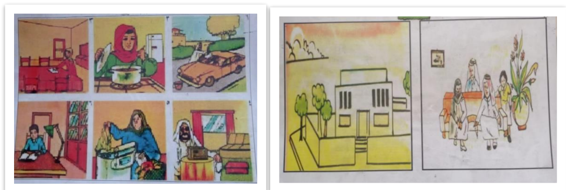
Gambar 2. Media Nonkonkret

Berdasarkan gambar 1 tersebut media konkret ditetapkan dan telah disiapkan guru di setiap kelas untuk membantu memahami siswa terkait mufradat isim (kata benda) seperti: motor, pepohonan, rumah, sayuran dll. Adapun untuk menjelaskan mufradat fi'il guru telah menyiapkan media non konkret dengan gambar sebagai berikut: