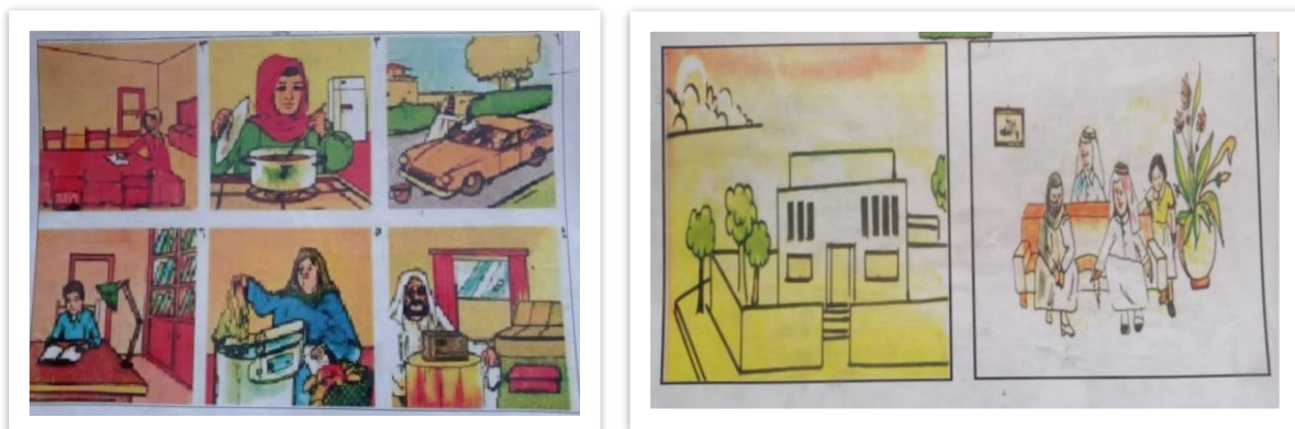
Gambar 2. Media Nonkonkret

Berdasarkan gambar 1 tersebut media konkret ditetapkan dan telah disiapkan guru di setiap kelas untuk membantu memahami siswa terkait mufradat isim (kata benda) seperti: motor, pepohonan, rumah, sayuran dll. Adapun untuk menjelaskan mufradat fi'il guru telah menyiapkan media non konkret dengan gambar sebagai berikut: