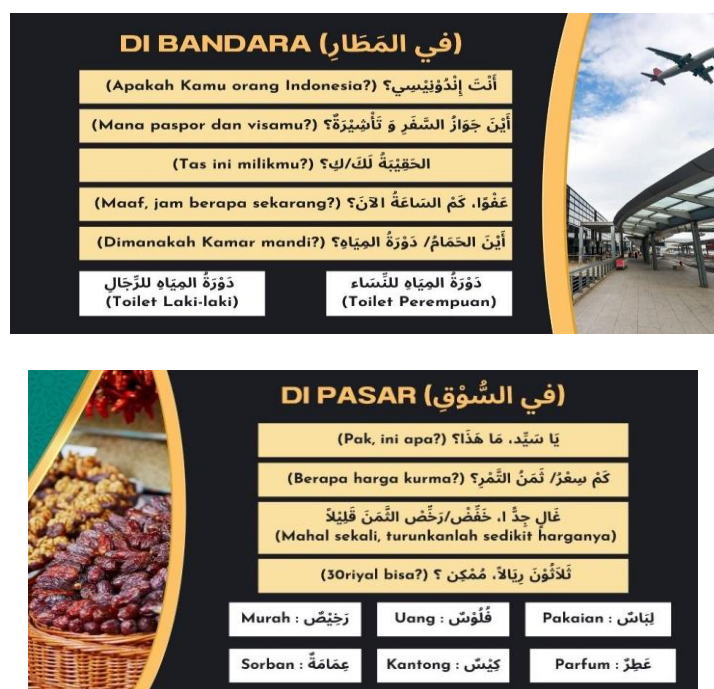
Gambar 3. Percakapan Dasar dan Umum

Program Studi Pendidikan Bahasa Arab Universitas Muhammadiyah Karanganyar telah menyusun berbagai percakapan komunikatif yang umum digunakan dalam komunikasi sehari-hari, khususnya bagi calon jemaah haji dan umrah yang tergabung dalam Komunitas Tour and Travel The Park Mall . Selain menyajikan dialog-dialog praktis yang dapat diterapkan dalam berbagai situasi selama perjalanan ibadah, program ini juga menyediakan kumpulan kosakata yang mendukung dan memperkaya keterampilan berkomunikasi para jemaah seperti dialog yang telah dipaparkan sebelumnya. Penyampaian materi dilakukan secara interaktif, sehingga peserta dapat lebih mudah memahami dan mengaplikasikan bahasa Arab dalam percakapan nyata. Dengan adanya pembelajaran bahasa Arab komunikatif ini, calon jemaah tidak hanya memperoleh pemahaman yang lebih baik terhadap istilah-istilah penting yang sering digunakan dalam konteks ibadah dan perjalanan, tetapi juga memperoleh kepercayaan diri yang lebih besar dalam berinteraksi dengan berbagai pihak di Tanah Suci, seperti petugas, penduduk lokal, maupun sesama jemaah dari berbagai negara.