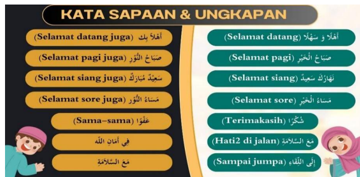
Gambar 2. Kata Sapaan dan Ungkapan

Percakapan Dasar dan Umum, serta Beberapa Kosakata