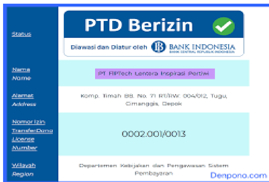
Gambar 1. Bukti Lisensi Flip dari Bank Indonesia

Lisensi dari Bank Indonesia didapatkan oleh Flip pada tanggal 4 Oktober 2016. Flip hanya memiliki lisensi dari Bank Indonesia tanpa lisensi dari OJK (Otoritas Jasa Keuangan) yang disebabkan karena Flip merupakan perusahaan transfer dana yang mana ada di bawah naungan Bank Indonesia. Sedangkan OJK mempunyai tugas sebagai pengawas industri keuangan seperti bank, asuransi, pasar modal, dan institusi keuangan lainnya. 13