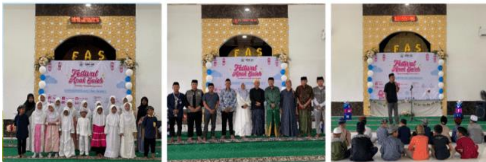
Gambar 8. Kegiatan Festival Anak Saleh

Faktor pendukung lancarnya kegiatan tersebut tak lepas dari peran kepala desa beserta tokoh masyarakat dan agama setempat dan juga para orang tua dari peserta yang turut hadir dan mendukung terlaksananya kegiatan ini, serta membantu mempersiapkan segala kebutuhan untuk kegiatan festival anak sholeh sehingga dapat dilaksanakan.