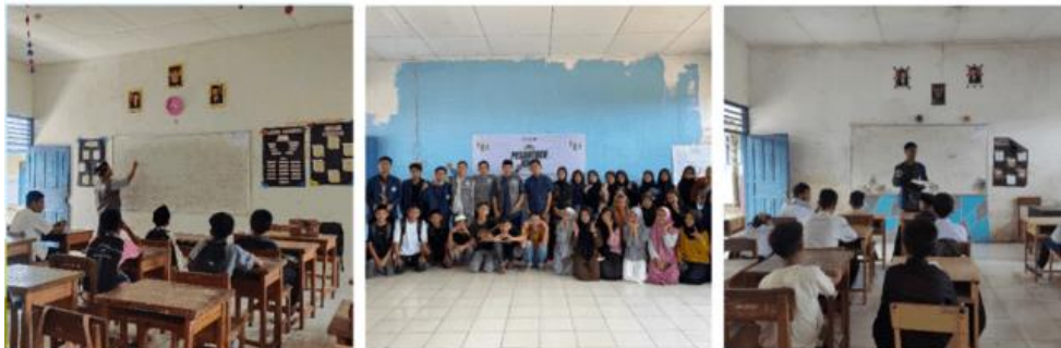
Gambar 10. Kegiatan Pesantren Kilat

Sebelum pelaksanaan kegiatan, kami melakukan beberapa persiapan, di antaranya sosialisasi dan diskusi serta koordinasi dengan sekolah tentang program yang akan kami laksanakan, menentukan penanggungjawab kegiatan, menentukan jadwal pelaksanaan dan meminta perizinan kepada pihak sekolah.