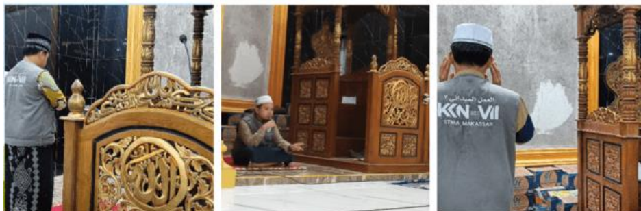
Gambar 7. Kegiatan Iktikaf dan Salat Malam

Program kerja Iktikaf dan Sahur Bersama merupakan program kerja khusus yang dilaksanakan di 10 malam terakhir di bulan Ramadan. Program kerja bertempat di Masjid Nurul Rahmah dan merupakan permintaan khusus dari pengurus masjid tersebut. Kegiatan ini diawali dengan berkoordinasi dengan pihak masjid terkait persiapan pelaksanaan kegiatan, mulai dari pembuatan jadwal dan juga menyiapkan perlengkapan yang dibutuhkan saat kegiatan berlangsung.