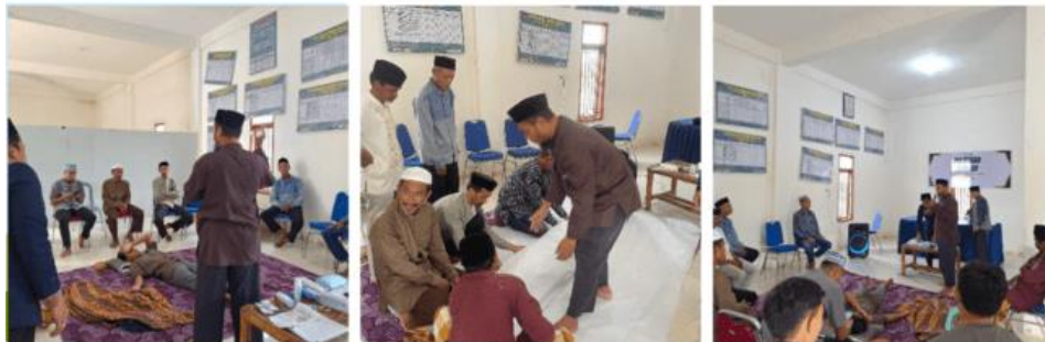
Gambar 9. Kegiatan Pelatihan Penyelenggaraan Jenazah