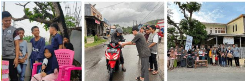
Gambar 6. Kegiatan Ramadan Mengaji dan Tebar Iftar

Ramadan mengaji merupakan program yang sebelumnya tidak pernah dialami oleh masyarakat di Desa Allaere dan Kelurahan Borong, di mana mahasiswa dan masyarakat akan membacakan ayat-ayat al-Quran di pinggir jalan. Kegiatan ini menarik perhatian masyarakat, bahkan sampai-sampai ada seorang bapak yang mengajak 1 keluarganya untuk mengaji bersama di pinggir jalan dengan membacakan surah yang mereka inginkan. Setelah itu dilanjutkan dengan pembagian menu buka puasa bagi masyarakat setempat.