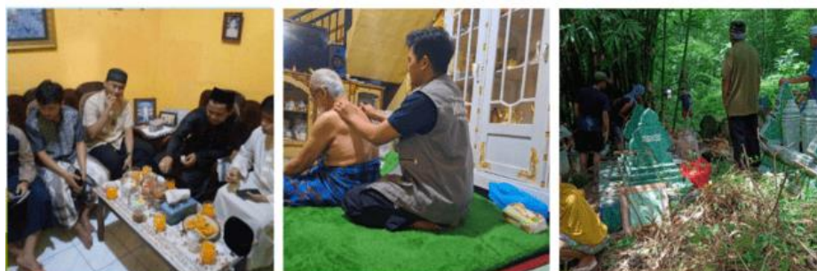
Gambar 5. Kegiatan Sosial

Kegiatan ini menjadi ajang silaturahmi mahasiswa KKN STIBA Makassar dengan masyarakat setempat, agar terbangun kedekatan selama kegiatan KKN berlangsung. Selain itu, mahasiswa juga bisa mengaplikasikan keterampilan yang mereka miliki sehingga masyarakat dapat terbantu dengan kehadiran mahasiswa, khususnya yang berkaitan dengan berbagi ilmu, dan juga keahlian seperti bekam, dan sebagainya.