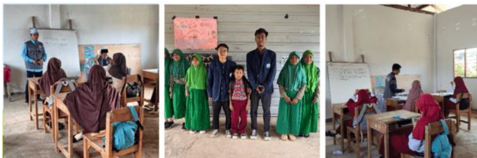
Gambar 3. Kegiatan Mengajar di Sekolah

Program kerja Mengajar merupakan program kerja umum yang berkolaborasi dengan posko 2 dan dilaksanakan di Yayasan Limpo. Program kerja ini berlangsung dari hari ke -11 pelepasan, 18 Maret 2024 hingga H-4 sebelum penarikan, 26 April 2024. Setelah silaturahmi ke sekolah-sekolah yang ada kemudian mengatur jadwal barulah pengajaran di sekolah-sekolah ini di laksanakan. Pengajaran di sekolah ini rutin dilaksanakan setiap pekannya dari hari senin hingga hari sabtu. Adapun proses belajar mengajar sendiri diawali dengan salam, kemudian do'a, pengabsenan, dan pemaparan materi, serta diakhiri dengan tanya jawab lalu kemudian penutup.