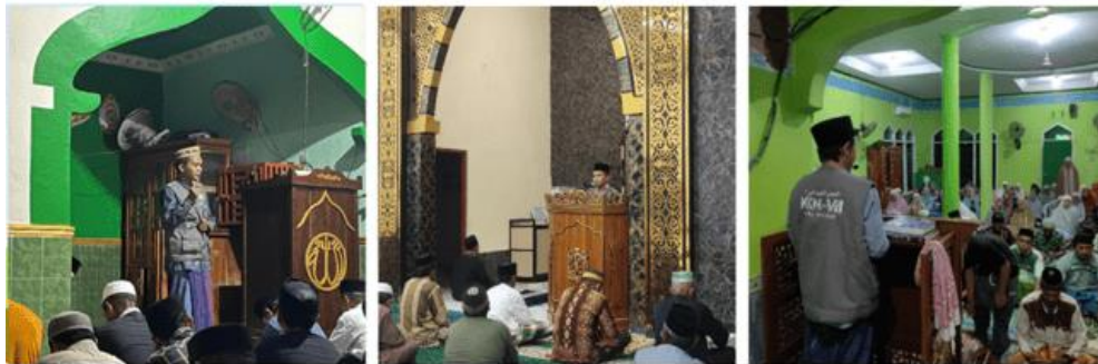
Gambar 1. Kegiatan Ceramah dan Imam Tarawih

Langkah atau tahapan persiapan dan pelaksanaan kegiatan dimulai dengan melakukan pendekatan kepada pihak masjid dan masyarakat sekitar sebagai awal untuk memulai program kerja. Kemudian meminta izin kepada pihak masjid terkait penyelenggaraan program kerja. Setelah disepakati, mahasiswa kemudian menyiapkan materi yang akan disampaikan selama kegiatan, dan terakhir melakukan koordinasi dengan pengurus masjid untuk memastikan kelancaran pelaksanaan program kerja.