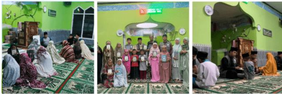
Gambar 2. Pembelajaran Al-Qur'an (TK/TPA)

Pembina TPA merespon dengan baik tujuan kami sehingga kami dipercayakan untuk membina para santri dalam hal pembelajaran al-Qur'an. Kegiatan kami dilaksanakan pada pagi dan siang hari dilokasi TPA Desa Punakarya.