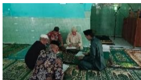
Gambar 4. Pengajaran Dirosa

Dalam satu pertemuan, mahasiswa biasanya membimbing 5–10 peserta secara bergantian dengan sistem one-on-one coaching dan bacaan bergilir . Durasi pembelajaran berkisar antara 60–90 menit setiap pertemuan, dengan total 20 kali tatap muka selama program KKN berlangsung.