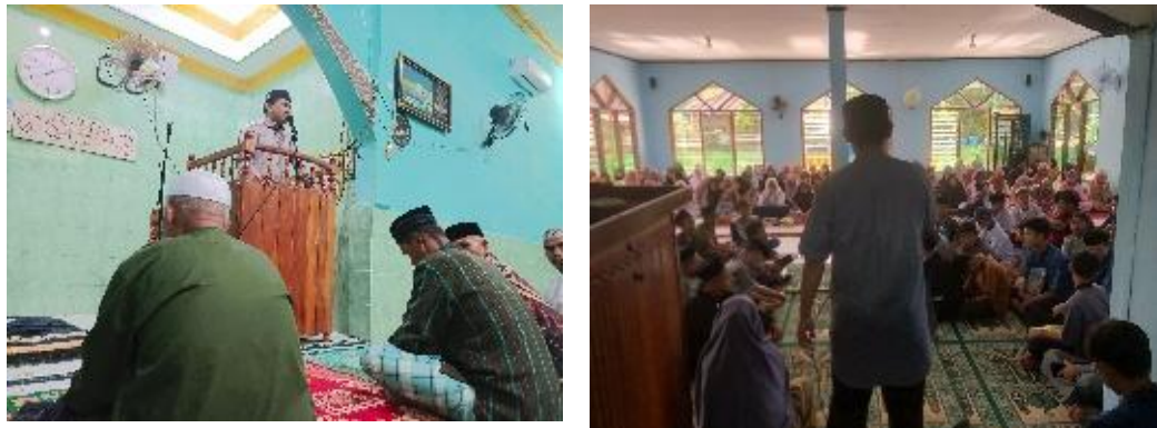
Gambar 6. Ceramah dan Pengajian

Selain itu, kegiatan dakwah mahasiswa sebagai imam, khatib, dan penceramah di berbagai masjid turut meningkatkan kualitas ibadah masyarakat. Banyak jamaah yang menyampaikan bahwa khutbah dan ceramah mahasiswa terasa lebih segar, aktual, dan komunikatif dibandingkan dengan ceramah rutin sebelumnya. Dari sisi remaja, keterlibatan mereka dalam kegiatan keagamaan (seperti kultum dan tadarus) memberikan pengalaman spiritual yang memperkuat identitas keislaman generasi muda.