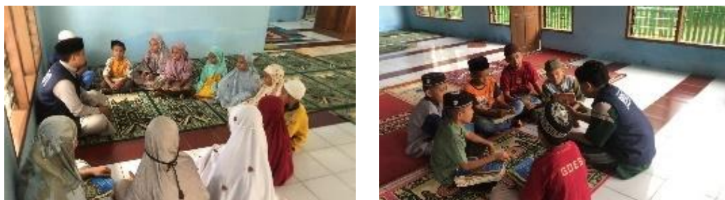
Gambar 5. Pengajaran TPQ

Metode pembelajaran di TPQ ini sangat variatif, meliputi tutor sebaya , hafalan bersama , permainan edukatif, kuis hafalan, serta praktik ibadah seperti salat berjamaah dan wudu yang benar. Anak-anak sangat antusias, bahkan sering datang lebih awal sebelum waktu belajar dimulai. Beberapa anak yang sebelumnya sulit fokus kini lebih disiplin dan menunjukkan peningkatan dalam kemampuan membaca dan hafalan. Para guru TPQ mengakui bahwa kehadiran mahasiswa membawa suasana baru yang lebih semangat dan terorganisir.