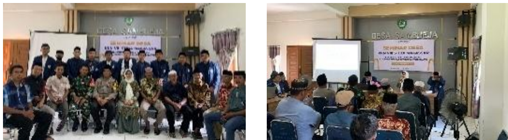
Gambar 3. Seminar Desa

Program PkM di Desa Sambueja diawali dengan observasi partisipatif dan seminar desa untuk mengidentifikasi kebutuhan serta potensi masyarakat. Berdasarkan hasil pemetaan tersebut, ditetapkan dua klaster utama kegiatan, yaitu literasi Al-Qur'an (melalui Dirosa dan penguatan TPQ) serta penguatan peran dakwah masyarakat (melalui pelibatan imam, khatib, dan penceramah lokal). Pendekatan ini berlandaskan prinsip community-based participation , di mana masyarakat dilibatkan secara aktif sejak tahap perencanaan hingga evaluasi. 18 Dengan begitu, tumbuh rasa memiliki dan kemitraan yang kuat antara mahasiswa, pengurus masjid, dan pemerintah desa.