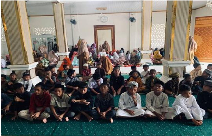
Gambar 4. Pelaksanaan Pesantren Kilat di SDN 87 Tamanroya