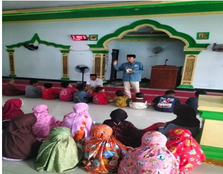
Gambar 5. Kegiatan Pembelajaran Bahasa Arab Dasar di Desa Biring Kassi