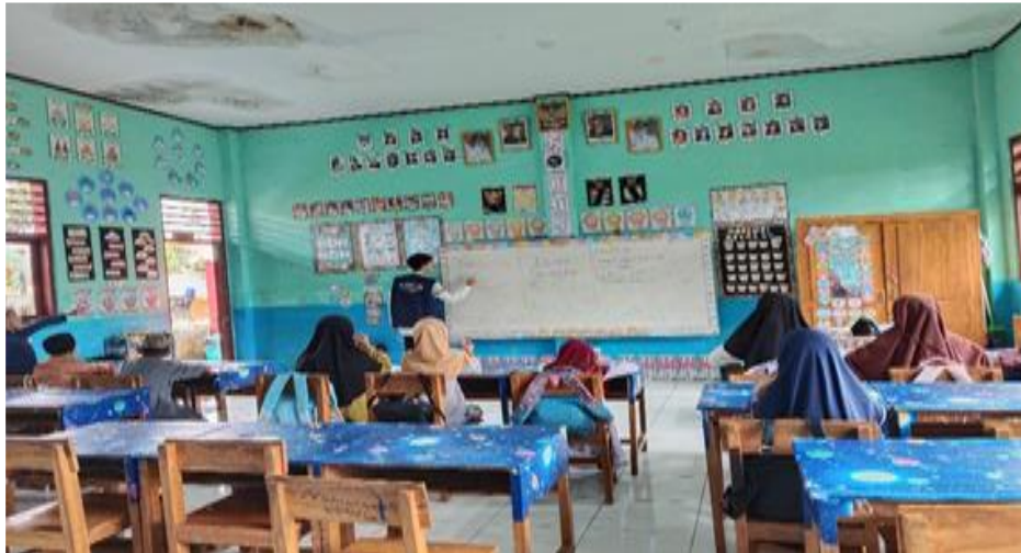
Gambar 3. Kegiatan Pembelajaran Umum di SDN 87 Tamanroya