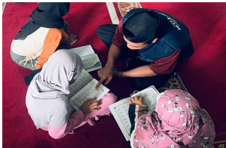
Gambar 2. Kegiatan Pengajaran TK-TPA di Desa Biring Kassi

Secara umum, program pengajaran TK-TPA memberikan dampak positif terhadap peningkatan literasi Al-Qur'an, hafalan doa-doa harian, dan pembentukan karakter Islami anak-anak. Program ini juga memperlihatkan bahwa pembelajaran Al-Qur'an yang dikombinasikan dengan pendekatan partisipatif dan menyenangkan mampu meningkatkan keterlibatan peserta didik secara lebih efektif.