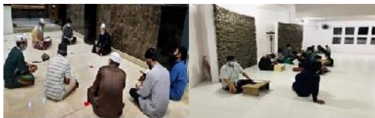
Gambar 7. Kegiatan Pengajaran Tahsin & Ilmu Tajwid

sudah cukup memadai 12 . Adapun kegiatan pengajaran ilmu tajwid dilaksanakan pada setiap subuh pada hari senin, rabu dan Jumat. Kegiatan ini diperuntukkan bagi anak-anak santri sekitar daerah Bukit Baruga 1, dan juga secara khusus Pondok Ar-Rahman Quran Learning (AQL).