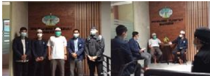
Gambar 1. Silaturahmi ke DPD WI Kota Makassar

mahasiswa dan Dewan Pimpinan Daerah (DPD) WI Makassar dan mempererat jalinan silaturahmi dengan pengurus DPD Wahdah Islamiyah kota Makassar. Selain itu, manfaat melakukan silaturahmi sebelum melaksanakan KKN ialah untuk menumbuhkan karakter mahasiswa 6 .