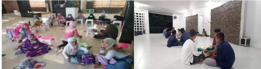
Gambar 5. Kegiatan Pengajaran TKA/TPA