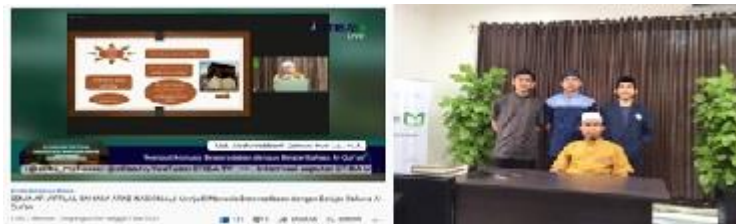
Gambar 2. Seminar Nasional Bahasa Arab Virtual