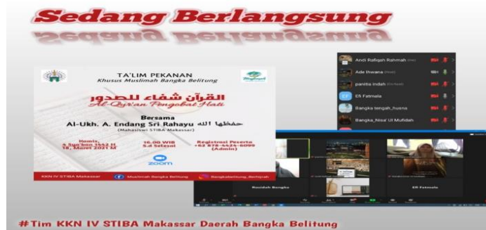
Gambar 1. Taklim Muslimah Pekanan

Adapun kendala pada kegiatan ini adalah jumlah peserta yang tidak pernah memenuhi target yang telah ditetapkan. Pada awal perencanaan program, tim KKN IV STIBA Makassar daerah Bangka Belitung menetapkan target peserta untuk kegiatan taklim pekanan adalah seratus orang, namun pada realisasinya, peserta yang hadir hanya berkisar antara tujuh sampai sepuluh orang. Kendala lainnya adalah masalah jaringan yang kurang kondusif untuk beberapa peserta sehingga tidak bisa turut hadir pada kegiatan taklim muslimah pekanan ini. Berbeda halnya jika taklim muslimah diselenggarakan secara offline , umumnya suasana taklim selalu ramai dengan candaan ibu-ibu muslimah dalam mendengarkan dan membenarkan materi taklim yang sesuai dengan realita kehidupan sehari-hari 8 .