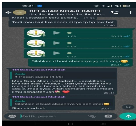
Gambar 5. Belajar Islam Intensif Online

Kendala yang dihadapi dalam kegiatan ini adalah jaringan yang kurang kondusif dan pada beberapa halaqah ada muslimah yang tidak memiliki aplikasi Zoom maupun Google Meet .