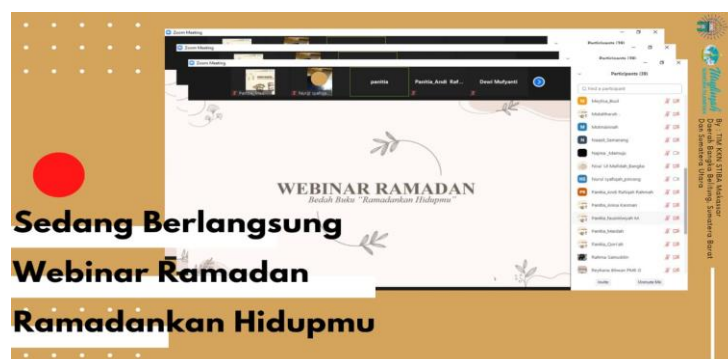
Gambar 6. Webinar Pra Ramadhan

Kegiatan ini dilaksanakan secara virtual dan dirangkaikan dengan bedah buku Ramadankan Hidupmu dan juga mengangkat tema yang sama dengan judul buku tersebut. Tujuan utamanya tidak lain agar para peserta dapat mempersiapkan mental dan ruhiah -nya serta menambah wawasan keislamannya sebelum memasuki bulan suci Ramadan. Pada webinar ini, tim KKN IV STIBA Makassar daerah Bangka Belitung menghadirkan pemateri Ustadzah Arimda, Lc. Selain penulis buku Ramadankan Hidupmu , beliau juga merupakan Kepala Keputrian di Sekolah Tinggi Ilmu Islam dan Bahasa Arab (STIBA) Makassar.