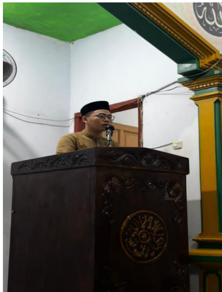
Gambar 2: Suasana Kultum Subuh

Adapun temuan unik pada kegiatan ini adalah tumbuhnya kesadaran bersama di kalangan jamaah bahwa keteraturan mengikuti Kultum subuh mampu mengokohkan kedisiplinan dalam ibadah harian, yang berfungsi sebagai benteng dalam menghadapi berbagai tantangan sosial. Sementara hambatan yang ditemukan meliputi variasi tingkat pemahaman keagamaan jamaah yang cukup heterogen, sehingga memerlukan adaptasi materi agar tetap inklusif dan tidak terkesan menggurui bagi kelompok masyarakat tertentu. Solusi yang diterapkan adalah melalui pendekatan dialogis dan partisipatif, di mana masyarakat dilibatkan aktif dalam memetakan permasalahan untuk memastikan materi dakwah benar-benar selaras dengan kebutuhan dan tingkat pemahaman jamaah.