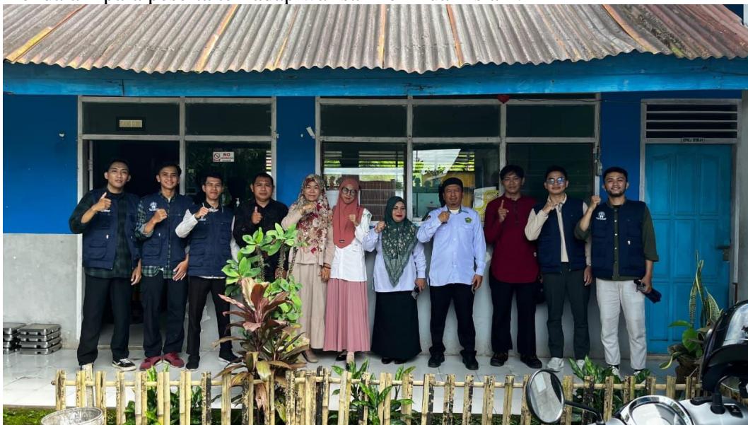
Gambar. 6: Suasana Pengajaran Bahasa Arab dan Pesantren Kilat Ramadan

Program pengajaran bahasa Arab difokuskan pada pengembangan kompetensi linguistik sebagai instrumen vital dalam memahami literatur keislaman klasik dan kontemporer, sementara pesantren kilat diintegrasikan sebagai sarana intensifikasi pendalaman materi teologis bagi generasi muda 38 . Dalam implementasinya, kedua inisiatif ini mengintegrasikan pembelajaran membaca teks keagamaan dan tadarus harian guna menumbuhkan kedekatan batin serta apresiasi mendalam para peserta terhadap warisan keilmuan Islam.