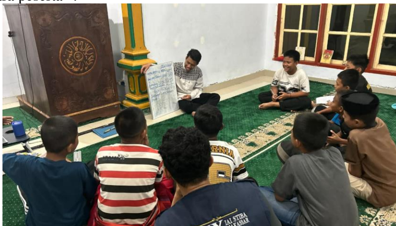
Gambar 4: Suasana Tahfidz Weekend

Program ini dilaksanakan untuk meningkatkan intensitas interaksi warga dengan Al-Qur'an melalui metode hafalan yang terstruktur, guna menanamkan nilai-nilai religius dalam ingatan jangka panjang. Pendekatan ini tidak hanya berfokus pada ketepatan pelafalan atau Tajwid guna menjaga integritas linguistik teks suci, tetapi juga bertujuan untuk menginternalisasi esensi spiritual Al-Qur'an bagi para peserta 35 .