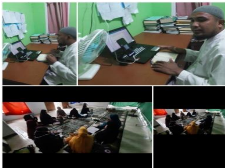
Gambar 3. Pelaksanaan Taklim Ibu Ibu Virtual

Peserta sangat antusias mengikuti kegiatan ini. Para peserta dapat menyimak materi dengan baik sehingga dapat menambah wawasan ilmu agama mereka. Di antara tema yang disampaikan adalah pentingnya menuntut ilmu agama, beramal saleh dan memperbanyak berdoa kepada Allah swt. sehingga hal ini diharapkan memberikan semangat kepada para peserta dalam berlomba-lomba melaksanakan kebaikan.