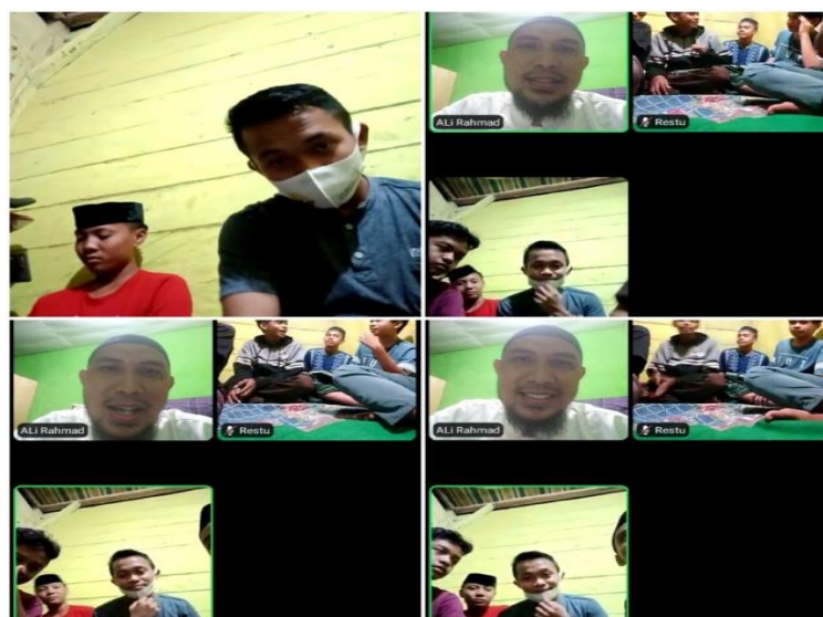
Gambar 2. Pelaksanaan Taklim Remaja Virtual

Peserta sangat antusias mengikuti kegiatan ini. Para peserta dapat menyimak materi dengan baik sehingga dapat menambah wawasan ilmu agama mereka. Di antara tema yang disampaikan adalah pentingnya menuntut ilmu agama, beramal saleh dan memperbanyak berdoa kepada Allah swt., serta penjelasan tentang keutamaan pemuda yang terpaut hatinya dengan masjid yang akan mendapatkan naungan Allah swt. di Padang Mahsyar di akhirat kelak sehingga hal ini diharapkan memberikan semangat kepada para peserta dalam berlomba-lomba melaksanakan kebaikan.