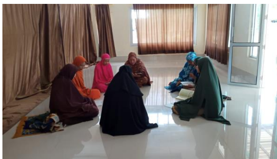
Gambar 2. Kegiatan Dirosah

Setelah mengikuti kegiatan terlihat perubahan yang baik dalam membaca Al-Qur'an. Mengajarkan Al Qur'an pada ibu-ibu usia lanjut cukup memberikan kesan kepada mahasiswa KKN karena adanya peserta yang tidak paham bahasa Indonesia sehingga mahasiswa menjelaskan dengan menggunakan bahasa daerah.