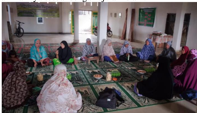
Gambar 1. Kegiatan Belajar Islam intensif

Belajar Islam intensif merupakan program kerja yang dirancang untuk mengajarkan agama Islam, hal-hal yang pokok dalam Islam dan wajib untuk diketahui oleh setiap muslim. Kegiatan dilaksanakan di rumah warga dan musala serta dilaksanakan setiap pekan. Kegiatan ini lebih banyak diisi dengan diskusi karena antusias peserta yang sering bertanya terkait persoalan kehidupan sehari-hari. Hasil dari program ini adalah ibu-ibu peserta berupaya menjalankan kehidupan sehari-harinya sesuai dengan ajaran Islam.