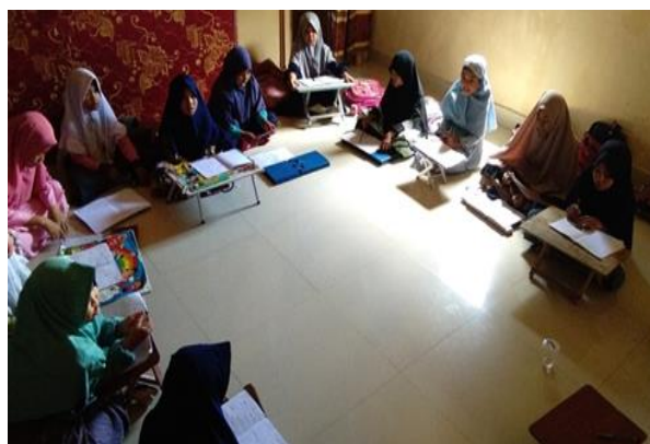
Gambar 3. Kegiatan Baca Tulis dan Hafal Al-Qur'an

Kegiatan Baca Tulis Hafal Al-Qur'an yang diperuntukkan bagi anak-anak TPA dilaksanakan pada TPA Al-Fitrah di tiga tempat, yaitu Desa Panreng Lautang, Desa Rappang dan Desa Bulu. Materi kegiatan adalah privat baca buku "Iqro'" dan menghafal surah-surah pendek. Kegiatan dimulai dengan membaca doa bersama, diikuti oleh arahan singkat, lalu menyimak bacaan santri secara bergiliran. Santri yang telah selesai membaca, diminta untuk menulis materi yang telah dibaca. Kegiatan diakhiri dengan talaqqi hafalan surah-surah pendek dengan metode klasikal.