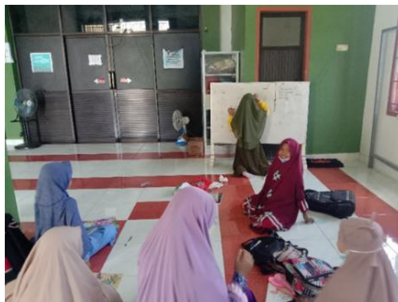
Gambar 4. Pengajara Bahasa Arab

Pembelajaran Bahasa Arab untuk anak-anak dilaksanakan setiap Senin-Jumat pukul 11.00-12.00 WITA. Kegiatan berlangsung di Pusat Dakwah Muslimah dengan empat kelompok dan pengajar dari Mahasiswi KKN STIBA Makassar Angkatan IV. Materi yang diajarkan adalah Bahasa Arab dasar dan menghafal beberapa kosa kata. Pemahaman dasar bahasa Arab juga sangat bermanfaat dalam menghafal Al-Qur'an karena beberapa kalimat yang dipahami artinya dapat membantu untuk mengingat menghafalan. 14 15