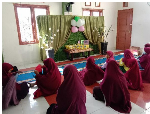
Gambar 6. Kegiatan Festival Anak Salehah

Kegiatan Festival Anak Salehah dilaksanakan pada hari Jumat, 26 Maret 2021. Kegiatan ini berlangsung secara offline di Pusat Dakwah Muslimah Sidrap dan diikuti oleh 18 peserta dengan beberapa lomba yang diagendakan seperti Rangking Satu , Musabaqah Hifzhil Qur'an dan games . Kegiatan sukses dilaksanakan dan tidak ada kendala berarti yang dihadapi.