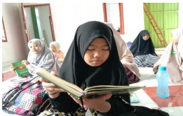
Gambar 1. Kegiatan Tahfīz Al-Qur'an

Kegiatan Tahfīz Al-Qur'ān dilaksanakan di Pusat Dakwah Muslimah Sidrap sebagai Posko Utama KKN STIBA Makassar Angkatan VI Kab. Sidrap dan di Rappang. Kegiatan Tahfīz Al-Qur'ān ini dilaksanakan setiap hari Senin-Jumat pukul 08.00-09.30 WITA. Berhubung karena kegiatan ini bersifat privat, maka setiap mahasiswi KKN mendampingi 4-6 orang santri. Hafalan yang disetorkan adalah juz 28, 29 dan 30. Kegiatan Tahfīz Al-Qur'ān ini diikuti oleh 12 peserta dari kalangan anak dan remaja. Teknik aplikasinya adalah santri datang ke tempat kegiatan dan menghafal secara mandiri kemudian menyetorkan hafalan tersebut kepada muḥaffīzah (guru tahfīz ). Setelah menyetorkan hafalan baru, peserta memperdengarkan bacaan lembaran yang akan dihafal berikutnya untuk dikoreksi cara bacannya sebelum memulai menghafal. Hal ini adalah sesuatu yang sangat penting dalam proses menghafal Al-Qur'an. 13 Program menghafal seperti ini biasanya diterapkan di Rumah Qur'an, Tahfīz Weekend dan menjadi pilihan untuk kaum muslimin yang ingin menghafal Al-Qur'an namun tidak mempunyai kesempatan untuk bergabung dengan pondok tahfīz .