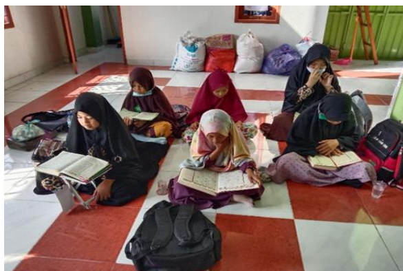
Gambar 2. Kegiatan Tahsīn al-Qirā'ah

Pembelajaran Tahsin untuk anak dan remaja dilaksanakan setiap Senin-Jumat pukul 09.30-10.30 WITA. Kegiatan berlangsung di Pusat Dakwah Muslimah dengan empat kelompok dimana setiap kelompok terdiri dari 4-6 peserta. Kegiatan ini dibimbing langsung oleh Mahasiswi KKN STIBA Makassar Angkatan IV. Kegiatan tahsīn diawali dengan penyampaian Teori Tajwid, lalu menyimak bacaan peserta satu persatu, kemudian dikoreksi sesuai dengan tingkat kemampuan bacaan Al-Qur'annya. Hal ini dilakukan karena setiap peserta memiliki kemampuan bacaan Al-Qur'an yang tidak sama sehingga kegiatan ini menggabungkan metode klasikal dan privat.