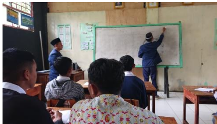
Gambar 7. Pembelajaran MA

mengajar mata pelajaran PPKN yang diluar dari jurusan kami selaku mahasiswa STIBA Makassar, akan tetapi salah seorang diantara kami menerima tawaran tersebut maka terjadilah proses belajar-mengajar pada mata pelajaran tersebut, ini merupakan tantangan tersendiri yang berhasil kami pecahkan sekaligus menambah kepercayaan guru-gurunya kepada kami, sehingga kegiatan apapun yang dilakukan sekolah tersebut pasti dilibatkan kepada kami mahasiswa KKN STIBA Makassar seperti kegiatan penamatan siswa/siswi semester akhir tingkat MTS dan MA dan juga pada kagiatan buka bersama. Adapun kendala selama kegiatan berlangsung yaitu keterbatasan alat transportasi sehingga menyebabkan keterlambatan kami dalam mengajar, solusi yang kami dapatkan terkait dengan masalah ini ketika salah seorang dari masyarakat setempat yang mau meminjamkan satu kendaraan kepada kami untuk memudahkan keberlangsungan pelaksanaan setiap kegiatan-kegiatan.