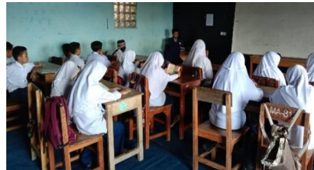
Gambar 8. Pembelajaran MTS