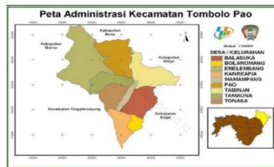
Gambar.1 Peta Kecamatan Tombolo Pao

Kelurahan Tamaona merupakan satu-satunya kelurahan di kecamatan Tombolo Pao di kabupaten Gowa dan sebagai ibukota dari kecamatan Tombolo Pao dimana kecamatan Tombolo Pao adalah kecamatan terjauh dalam wilayah kabupaten Gowa yang berbatasan langsung dengan kabupaten Sinjai. Kelurahan Tamaona berbatasan dengan desa Erelembang, desa Pao, desa Tonasa dan desa Mamampang. Kelurahan Tamaona berada dalam ketinggian berkisar antara 700-1350 di atas permukaan laut dan suhu 30 s/d 50° C. Kondisi wilayah kelurahan Tamaona adalah dataran tinggi dan pegunungan serta desa berbentuk lonjong dengan jarak dari kota Sungguminasa kurang lebih ±96 Km, dan dari kota Malino berjarak kurang lebih ±40 Km.