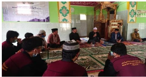
Gambar 4. Pelatihan Rukiah

kegiatan tersebut, dua posko tersebut adalah posko kelurahan Tamaona dan posko desa erlembang. Pengalaman menarik yang dirasakan selama kegiatan berlangsung diantaranya, ada di antara peserta pada saat kegiatan berlangsung merasa takut dengan proses pengobatannya karena banyaknya darah yang keluar dari tubuh pasien, namun setelah dijelaskan akan manfaat pengobatan tersebut maka banyak diantara mereka yang ingin berpartisipasi untuk menjadi pasien. Kegiatan ini terlaksana atas dukungan, masyarakat, kepala dusun bontomanai (Bpk. Arsil Dg. Masiga), panitia masjid, dan klinik STIBA Makassar. Kendala yang dihadapi dalam berlangsungnya kegiatan ini karena faktor biaya, pemateri, waktu dan tempat pelaksanaan dan kurangnya alat bekam. Akan tetapi dapat diatasi kendala-kendala tersebut karena kami melaksanakannya dengan menggabungkan dua posko yang saling bekerja sama dalam mengatasi masalah dana kegiatan dan tempat serta dengan adanya kerja sama itu maka disepakati bahwa kegiatan ini melibatkan UKM kesehatan STIBA Makassar yang dibina langsung oleh ust. Ibrahim Rauf Mande selaku praktisi rukiah dan bekam sekaligus pemateri pada kegiatan tersebut, adapun masalah alat-alat bekam yang masih kurang bisa kami atasi karena adanya bantuan dari UKM Kesehatan Stiba Makassar.