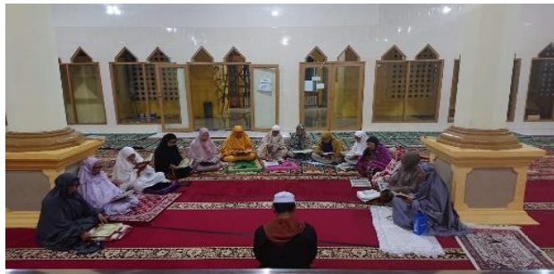
Gambar 3. Proses Pembelajaran Ilmu Tajwid