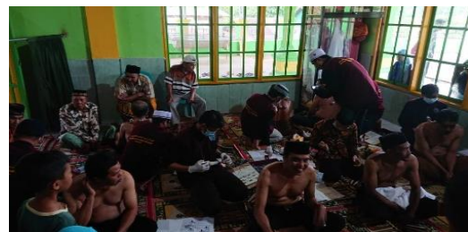
Gambar 5. Pengobatan Bekam