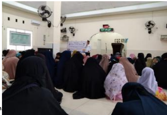
Gambar 1. Kegiatan Festival Ramadhan di Desa Moncongloe Lappara

Festival ditutup dengan taujihat oleh Imam Desa Moncongloe Lappara yang memberikan apresiasi kepada mahasiswi KKN V STIBA Makassar sebagai pelaksana yang telah memfasilitasi anak-anak Desa Moncongloe Lappara mengisi hari-hari di bulan Ramadhan dengan kegiatan yang bermanfaat dan berkualitas. Perasaan suka cita juga tampak dari para peserta festival yang baru pertama kali mengikuti kegiatan menarik seperti ini di bulan Ramadhan, sehingga menjadikan momen ini begitu berkesan.