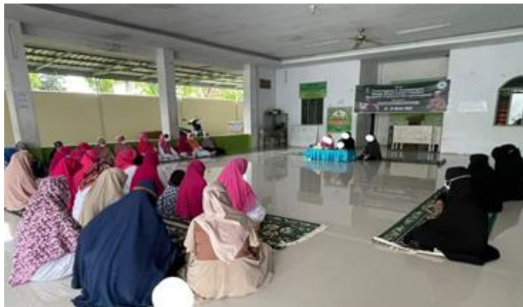
Gambar 5. Kegiatan Ta'lim Muslimah