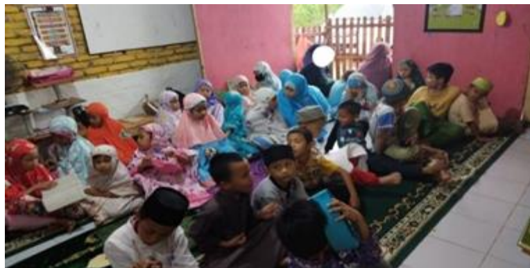
Gambar 2. Kegiatan Pengajaran dan Pembinaan TK/TPA