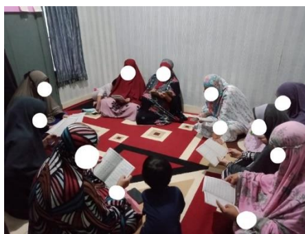
Gambar 1. Kegiatan pengajaran dan pembinaan DIROSA

Hasil kegiatan ini adalah adanya peningkatan kemampuan peserta dalam membaca Al-Qur'an, dengan penyebutan huruf hijaiyah dengan benar. Kegiatan ini akan tetap dilanjutkan setelah berakhirnya masa KKN oleh Muslimah Wahdah Daerah (MWD) Cabang Manggala