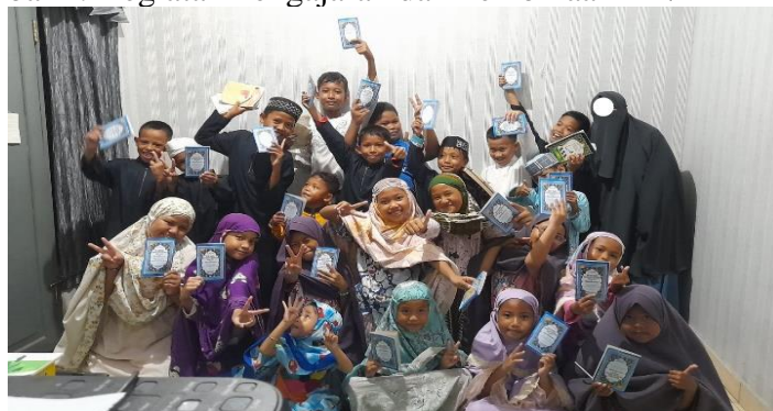
Gambar 3. Kegiatan Pembagian donasi Buku Materi Hafalan TK/TPA