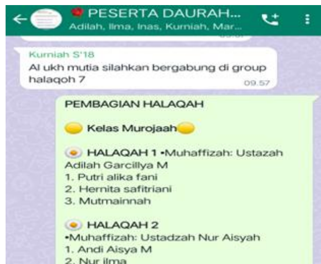
Gambar 4. Kegiatan Daurah Menghafal secara offline dan online