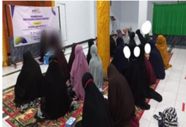
Gambar 6. Kegiatan Penyelenggaraan Jenazah di Mesjid HM Masting.