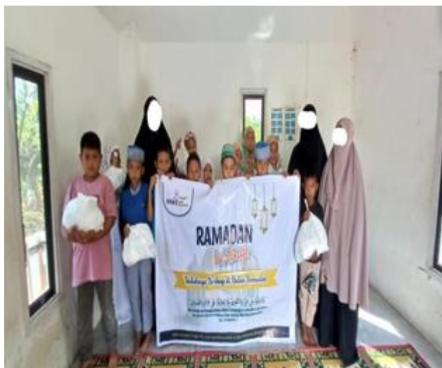
Gambar 8. Kegiatan Ramadhan Berbagi