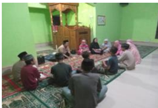
Gambar 2. Pengajaran Al-Qur'an (Tingkat TK/TPA, Remaja, dan Dewasa)

Selama tiga hari melakukan observasi di tiga dusun yang ada di Desa Bonto Bunga, tim kemudian membagi wilayah kerja KKN di desa ini sesuai jumlah dusunnya secara merata. Tiga posko mahasiswi KKN masing-masing melaksanakan program kerja pengajaran TPA di dusunnya masing-masing. Ada dua masjid yang tidak bisa dijangkau oleh tim mahaiswi untuk melakukan pengajaran. Akhirnya, tim mahasiswa melaksanakan program mengajar TPA di dua masjid tersebut, yaitu Masjid Nurul Yaqin Dusun Manjalling dan Masjid Nurul Hidayah Dusun Bonto Bunga.