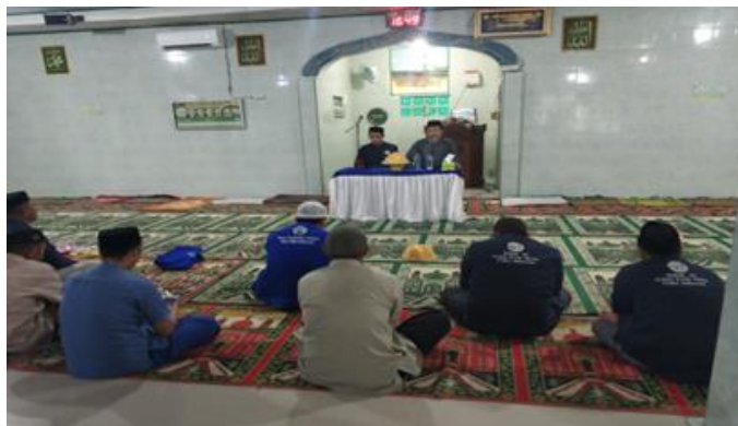
Gambar 5. Tabligh Akbar Persiapan Ramadhan

Sebagai solusi, tim menyarankan agar pembentukan kepanitiaan dapat dipercepat minimal dua pekan sebelum acara dimulai sehingga persiapan menjadi lebih maksimal. Begitu juga, sosialisasi kegiatan hendaknya lebih digencarkan beberapa hari sebelum acara agar warga dapat bersiap-siap untuk menghadiri kegiatan.