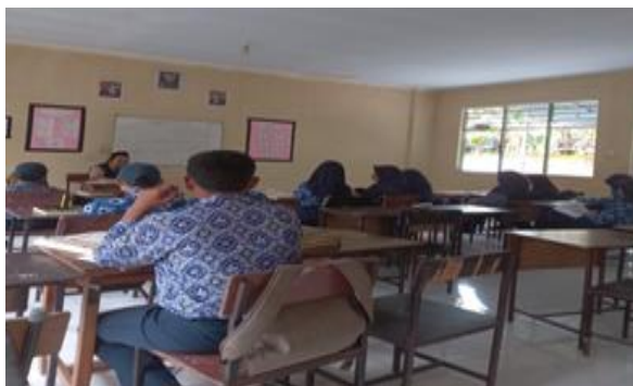
Gambar 3. Kegiatan Pengajaran di MTS dan SMK Fardhillah

Setelah mengetahui sekolah-sekolah yang ada di desa, selama 3 hari, tim melakukan kunjungan ke tiap sekolah yang ada dan bersilaturahmi sekaligus menyampaikan maksud kedatangan tim sebagai mahasiswa KKN untuk dapat melaksanakan program mengajar di sekolah-sekolah. Kunjungan tersebut disambut dengan hangat oleh pihak sekolah-sekolah.