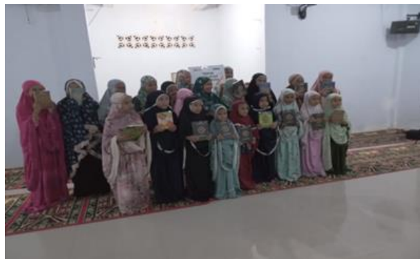
Gambar 4. Tebar Al-Qur'an

Kendala yang didapati adalah terbatasnya mushaf Al-Qur'an yang dapat disalurkan padahal yang membutuhkan lebih banyak. Tim menyarankan kepada mahasiswa KKN berikutnya untuk dapat mengumpulkan donasi lebih awal dan lebih gencar karena keberadaan mushaf-mushaf Al-Qur'an yang standar di daerah pedesaan masih kurang.